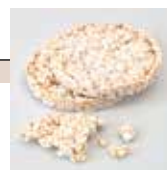
Galettes de riz