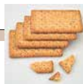
Crackers à la farine complète