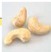
Noix de cajou