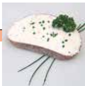
Fromage frais sur une tranche de pain