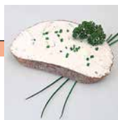
Frischkäse auf Brot